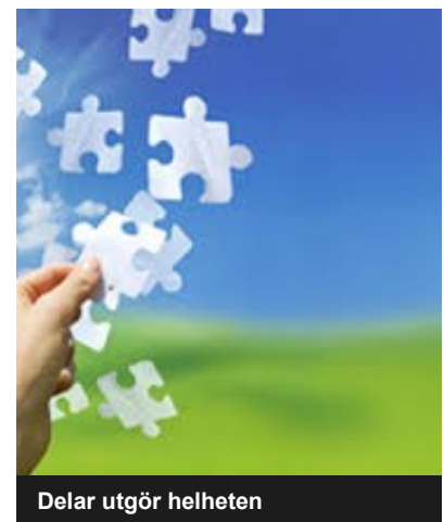
Delar utgör helheten

Vi återkopplar resultaten individuellt till varje deltagare och går igenom deltagarens utvecklingsområden.