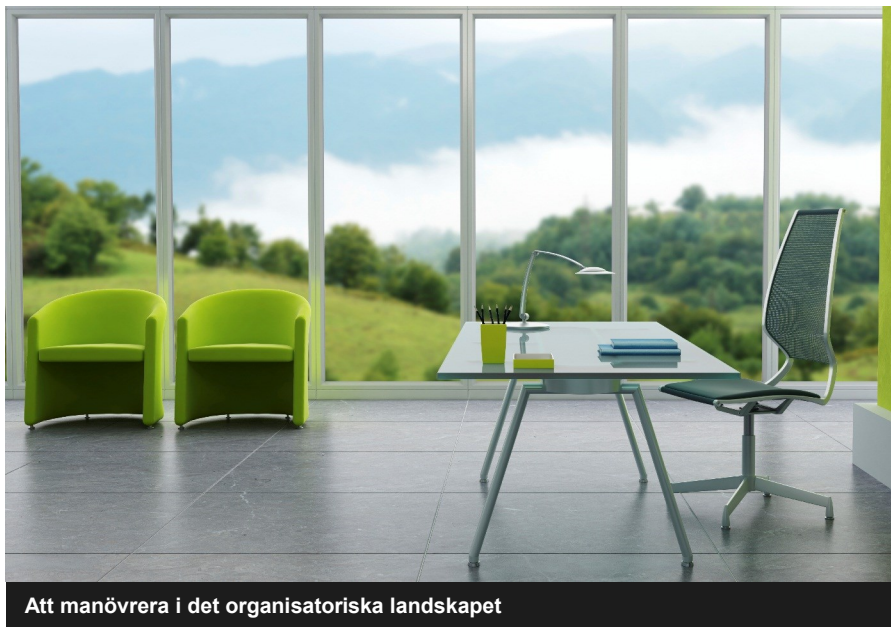
Att manövrera i det organisatoriska landskapet